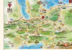
Urla Bağ Yolu

Urla'nın tarihi ve kültürel değerlerinin, gelenek ve göreneklerinin derlenip kayıt altına alındığı UKTA Müzesi, 2023 yılının Mayıs ayında ziyaretçilere açılmıştır. İlçenin eski yapılarından olan tarihi Arditi Köşkü (Eski Tekel Binası) gerçekleştirilen mimari tasarım ve uygulamalarla restore edilerek, modern bir müze anlayışı doğrultusunda UKTA Müzesi için bir arşiv ve sergi alanı olarak yeniden tasarlanmıştır.