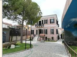
Urla Kent Tarihi ve Arşivi (UKTA) Müzesi

Arasta olarak da tanınmaktadır. Günümüzde inatla yaşatılmaya çalışılan bu tarihi pazar; kahve dükkanları, kafeteryalar, aktarlar ve organik ürünler satan tezgahlardan oluşmaktadır. Urla'nın bilinen en eski ticaret merkezleri arasındadır.