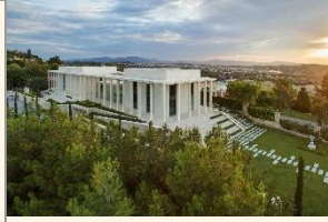
Arkas Sanat Urla

Evliya Çelebi'nin hurma zeytinini övdüğü Urla, tarihe ve engin bir zeytinyağı bilgi birikimine şahitlik eden anıt zeytin ağaçları ile Urla! Konu Zeytin ve zeytinyağı olunca Urla üzerine söylenecek çok şey bulunmaktadır. Limantepe kazılarında, M.Ö. 3000'den kalma zeytin tanelerini ezmek için kullanılan küçük el havanları, öğütme taşları, zeytinyağını karasudan ayırtmaya yarayan seramik kaplar ve daha sonraki dönemlere ait zeytinyağı depoları bulunmuştur.