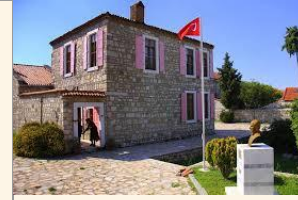
Necati Cumalı Anı ve Kültür Evi

Osmanlı döneminde bulaşıcı hastalıkların önüne geçilmesi amacıyla kullanılmıştır. 1865'te ilk Osmanlı karantina bölgesini kuran Fransızlardır. Kurulan tesis, ticaret ve yolcu gemileri ile özellikle kuzey hac yolu için gelen hacılar için düşünülmüş ve 1950 yılına kadar aktif kalmıştır. 150 yıl önce inşa edilen ve ölümcül hastalıklara ilk müdahalenin yapıldığı tahaffuzhane, dönemin en ileri sağlık merkezlerinin başında gelmektedir.