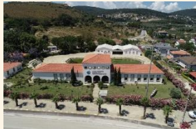
Ankara Üniversitesi Mustafa Vehbi Koç Deniz Arkeolojisi Araştırma Merkezi

Yaklaşık olarak İzmir merkeze 40 km uzaklıkta bulunan Urla'ya çok kolay şekilde ulaşım sağlayabilirsiniz. Özel aracınızın yanında toplu taşıma araçlarını da kullanarak varmanız mümkündür. Urla gezilecek yerleri, tarihi, doğal ve kültürel güzellikleri oldukça fazladır. Tarih boyunca farklı medeniyetler tarafından önemli bir yer olarak kabul edilmiş Urla, antik kalıntıları ile tarihsel yolculuk yapmanıza da yardımcı olmaktadır. Urla'da sanat ve kültür de önemli bir yer tutmaktadır. Urla plajları ve gizli kalmış koyları ile huzurlu bir deniz tatili gerçekleştirebilirsiniz. Plajların birçoğu mavi bayraklı plajlardır.