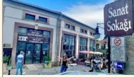
Urla Sanat Sokakı

Tarihi olarak 19'uncu yüzyıla kadar geri götürülebilen bu sokak, turistlerin de en popüler bölgelerinden biridir. Sokakta seramikten heykele müzikten ahşap oymalara kadar pek çok etkinlik bulunmaktadır. Ayrıca etrafta yer alan zanaat ve el işi atölyeleri de el yapımı hediyelik ve süs eşyalarını alabilmenize fırsat tanıyor.